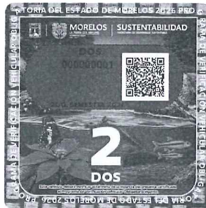
Primer y segundo semestre 2026 Constancia de verificación vehicular tipo doble cero (00)