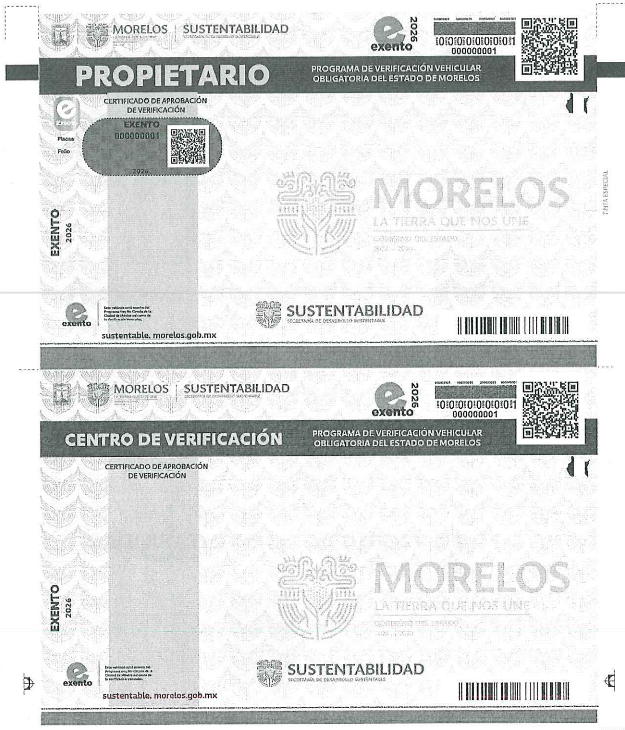
Primer y segundo semestre 2026 Reverso de la constancia de verificación tipo exento (e)